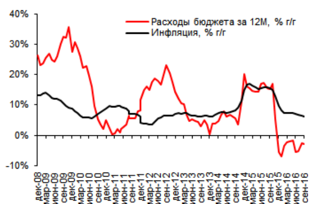
Рис. 2: Расходы бюджета за 12М и инфляция, % г/г